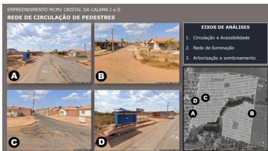
FIGURA 5 Estudo Desenho e Integração Urbana MCMV Cristal da Calama

Os pontos de ônibus (Foto D) apresentaram uma estrutura mais recente, metálica, com proteção na parte superior e nas laterais e com assento, porém sem os informativos necessários, o trajeto até o embarque não possui sombreamento e nem acessibilidade. A rede de iluminação também é atendida. Este quesito foi atendido de maneira satisfatória pelos três empreendimentos, porém, sendo necessária a manutenção regular pelo poder público, sendo um item importante para a manutenção não só do conforto da circulação, mas para a segurança dos moradores.