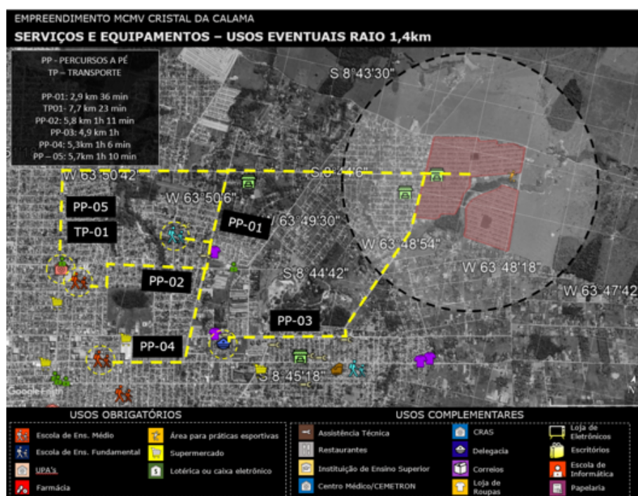
FIGURA 5 Levantamento de Ofertas, Equipamentos e Serviços MCMV Cristal da Calama

Para analisar a integração urbana, foi avaliado como o empreendimento se relaciona com o seu entorno imediato, no sentido de compreender os tipos de conectividades urbanas existentes. O parâmetro da análise é calcular o percentual do perímetro do empreendimento que possui relação direta com o entorno efetivamente urbano. Para que o perímetro do entorno seja de fato considerado para esta análise, foram observadas as seguintes situações: é considerado entorno quando abrigar edificações e/ou equipamentos e não constituam barreiras físicas para a circulação de pessoas, tais como áreas de proteção ambiental, grandes glebas vazias, quartéis, grandes equipamentos de infraestrutura como energia, tratamento de esgoto, complexos industriais, na medida em que constituem barreira de circulação.