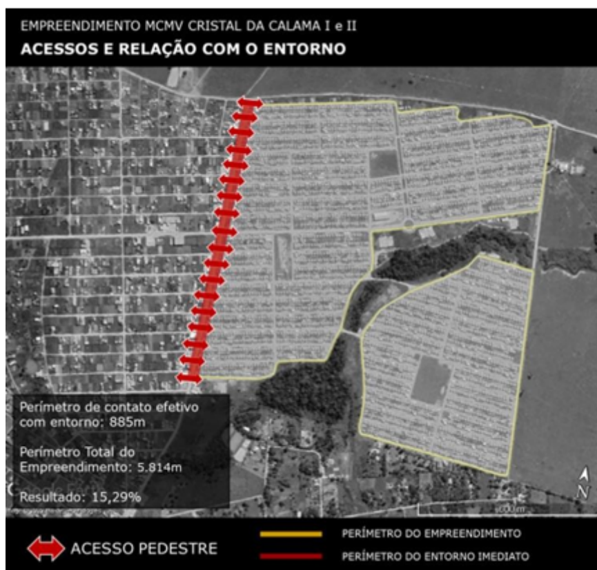
FIGURA 4 Levantamento do entorno imediato MCMV Cristal da Calama