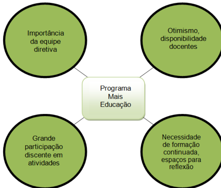
Figura1: Aspectos relacionados a experiência dos professores por meio do Programa Mais Educação.

Discutidas as questões acerca da Proposta Político Pedagógica e do Regimento Escolar, um segundo assunto foi questionado aos professores: O Programa Mais Educação. Sobre esse assunto os professores comentaram as experiências vividas na escola durante o período em que foram desenvolvidas atividades/oficinas do programa. Dessa forma, surgiram quatro aspectos relacionados a essa experiência conforme pode ser visto na figura abaixo: