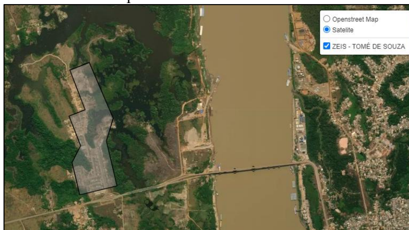
Mapa 01 – Zeis Tomé de Souza

Disponível em: https://geoportanal.portovelho.ro.gov.br/planejamento_urbano/zeis_tome_souza.html