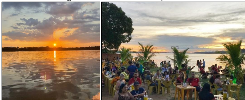
Imagem 01 e 02 – Mirantes e o pôr do sol

A cultura de Porto Velho é bastante diversificada, dado que a cidade recebeu um grande volume de população de diferentes origens, com destaque para africanos e europeus. Além da cultura, Porto Velho tem rica biodiversidade e esconde paraísos naturais exuberantes. A cidade é rodeada pela biodiversidade amazônica, com florestas às margens do rio Madeira, onde é possível fazer passeios de barco. Culturalmente tem-se diversos mirantes à beira do Rio Madeira que atraindo o turismo local pelas belas paisagens naturais nos fins de tarde, devido ao lindo pôr do sol (Imagem 01) em mata nativa na margem esquerdo do rio.