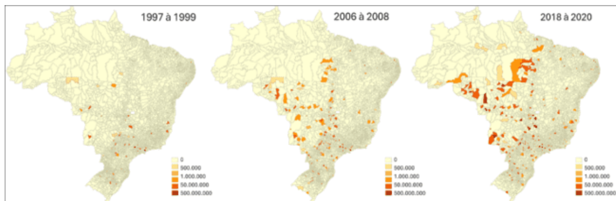
Figura 5 – Mapa de Aumento da Exportação de Carne Bovina.

Existem vários fatores que contribuíram para a expansão da produção bovina no Brasil ao longo dessas duas décadas. Os produtores de carne bovina foram motivados a expandir suas operações devido ao aumento da demanda por carne bovina tanto no mercado interno quanto no exterior. Além disso, a produtividade por hectare aumentou como resultado dos avanços tecnológicos, que incluem melhorias genéticas no rebanho, métodos de manejo e métodos de nutrição. O financiamento dessas melhorias e a expansão da área de pastagem foi facilitado pelo acesso ao crédito rural. A expansão também foi facilitada por políticas públicas de incentivo ao agronegócio, como programas de financiamento à agricultura e pecuária e crédito subsidiado.