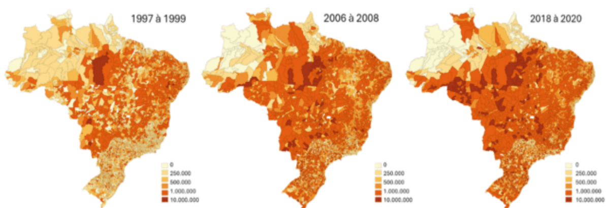
Figura 3 – Mapa de Aumento do Crédito Rural de Investimentos.

pecuária. Além disso, o aumento da exportação de commodities como carne bovina e soja aumentou a necessidade de financiamento para atender à demanda global. Por fim, a adoção de novas tecnologias no campo, como a mecanização e o uso de insumos modernos, exigiu maior acesso a crédito, o que impulsionou a expansão.