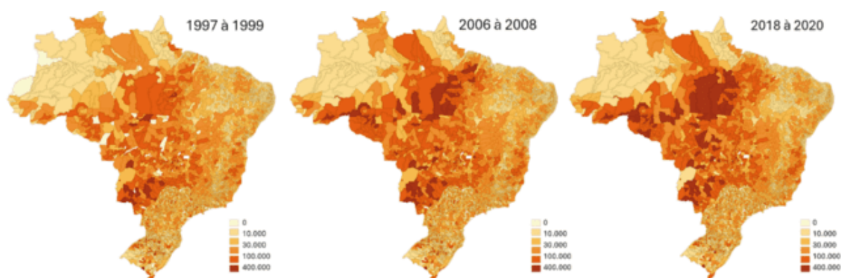
Figura 4 – Mapa de Aumento da Produção Bovina.

Vários fatores podem explicar o aumento do crédito rural de investimento. Para começar, os produtores receberam subsídios e foram facilitados a obter crédito para comprar máquinas, equipamentos e tecnologias agrícolas por meio de políticas de incentivo ao crédito rural, como o Plano Safra. Além disso, o aumento da fronteira agrícola em áreas como o Norte e o Nordeste exigiu mais fundos para preparar as terras e atualizar a produção. O aumento da exportação de commodities, que aumentou a necessidade de investimentos para atender à demanda internacional, foi outro fator significativo. Por fim, a modernização da agricultura, que resultou da implementação de novas tecnologias e mecanização, fez com que a quantidade de capital necessária aumentasse, o que levou à expansão do crédito de investimento.