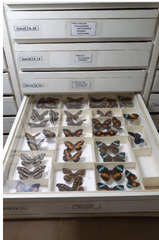
Figura 1. Borboletas depositadas em gavetas entomológicas.